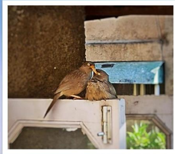
1 st - Tavish Bhradwaj