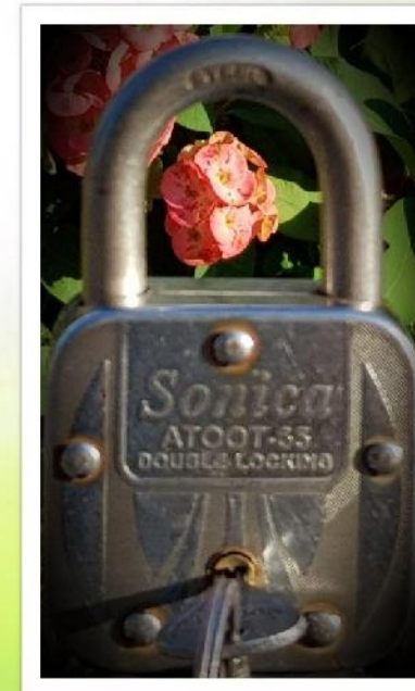
2 nd - Twisha Verma